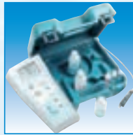
PH Metro PH25